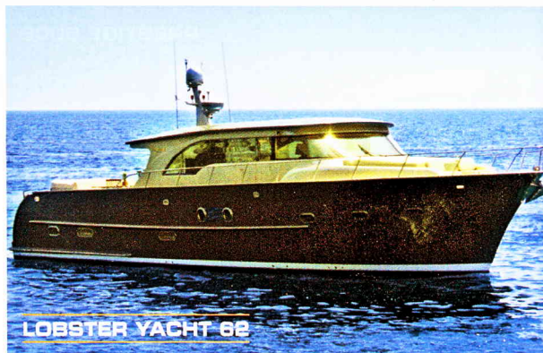
LOBSTER YACHT 62

Scheda tecnica: Lunghezza f.t. m 18,75 - larghezza m 4,99 - immersione m 1,35 - dislocamento kg 23.700 - motorizzazione 2x800 HP Man - velocità massima nodi 28 - velocità di crociera nodi 22 - riserva carburante litri 4.000 - riserva acqua litri 620.