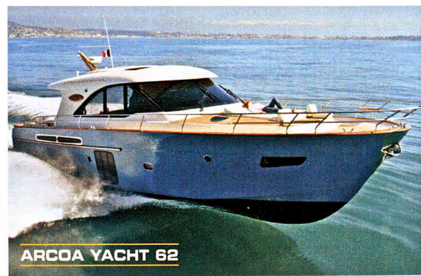
ARCOA YACHT 62