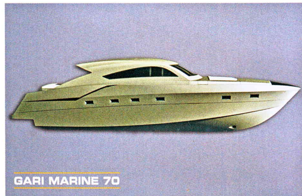
GARI MARINE 70