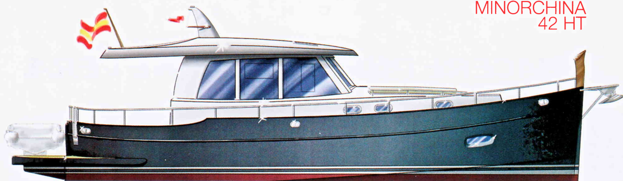
MINORCHINA 42 HT