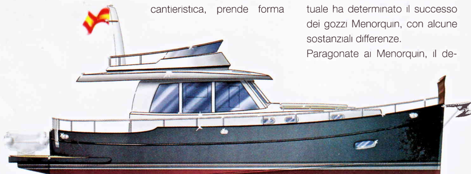
MINORCHINA 42 FLY